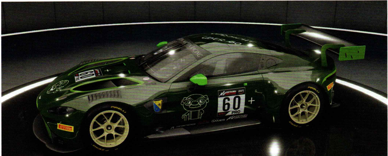
Mit dem wunderschön vorbereiteten Aston Martin Vantage V8 GT3 in „British Green“ konnte das Team das selbst gesteckte Ziel erreichen und seine Erwartungen mehr als erfüllen.